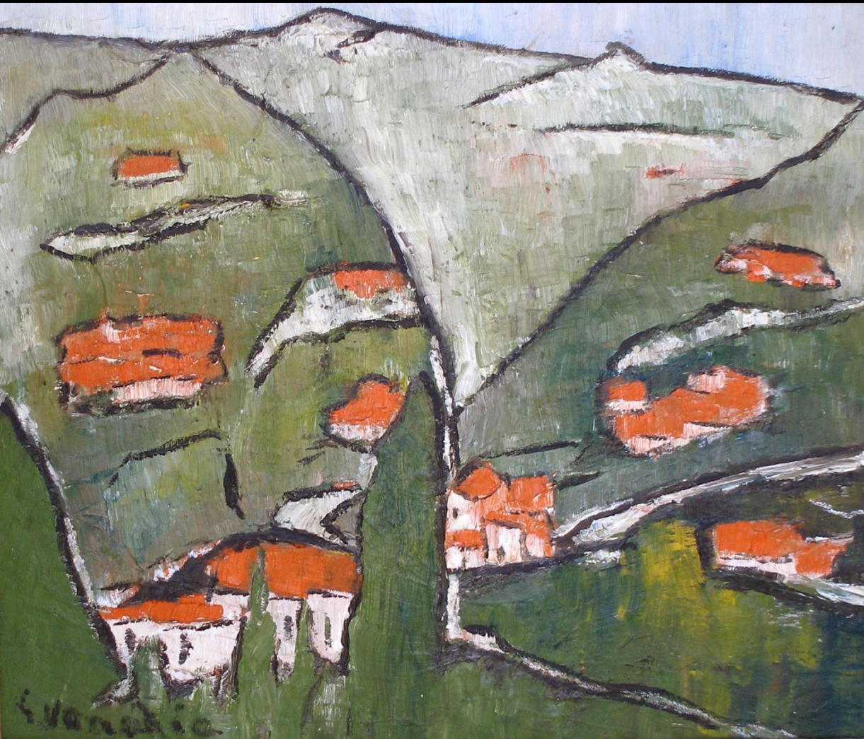
Figura 1 e 2: dipinti di Giuseppe Vanadia (da Il mondo poetico di Giuseppe Vanadia di Virginia Buda, 2012)